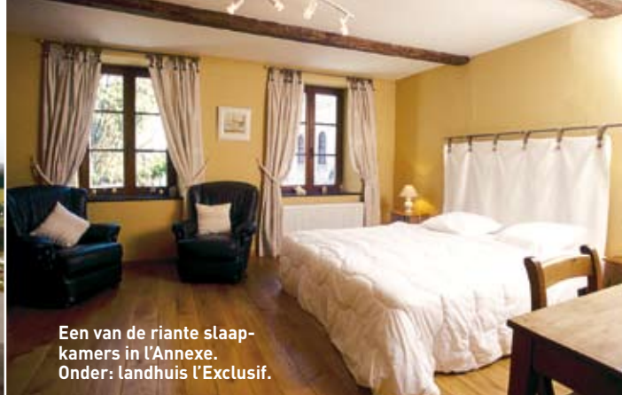
Een van de riante slaapkamers in l'Annexe. Onder: landhuis l'Exclusif.