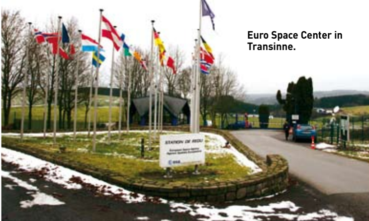
Euro Space Center in Transinne.