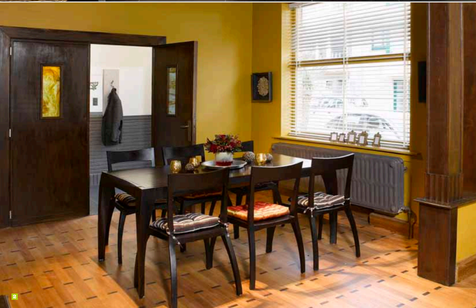
1 In deze lounge wordt de sfeer opgeroepen van een hotellobby, een ontmoetingsplaats waar iedereen passeert. 2 Naast het warme geel kreeg de helft van de muren een donkere tint. 3 Het bed staat op een klein verhoog, wat een speels element oplevert.