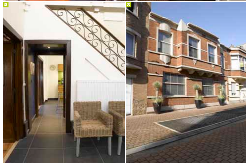
1 De centrale ‘lounge’ valt meteen op. Het is een grote vierkante ruimte die helemaal opengewerkt is tot het dak. 2 Doorgang vanuit de patio tot aan de keuken. 3 De drie grote potten met yuca's en duingras voor de gevel brengen ons onmiddellijk in vakantie sfeer. 4 De indrukwekkende koepel van 52 gekleurde glasramen-in-lood zorgt voor veel binnenvallend licht.