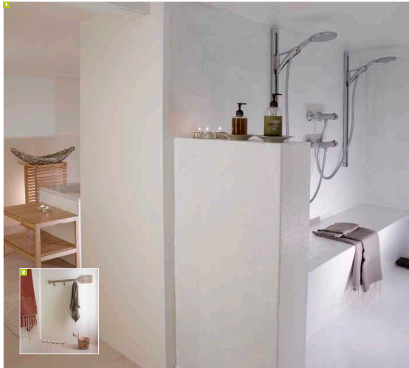
1 In de kelder werd een sauna, een verwenbad voor twee en een zitdouche gebouwd. 2 Een roeispaan als kapstok en ronde spotjes in de muren zijn kleine accenten die naar de zee en boten refereren. 3 De twee grotere kamers kregen elk een eigen badkamer.

Op de verdieping zijn er twee grotere kamers die mekaar spiegelbeeld zijn, met een eigen badkamer. Waar kon, werd de houten vloer behouden. De bedden staan op een klein verhoog, wat een speels element in een strakke ruimte oplevert. De badkamer kreeg een gebogen muur, wat extra ruimte en licht schiep. De derde, kleinere kamer vroeg het meeste creatieve denkwerk. “We wilden deze kamer evenwaardig maken aan de andere, hoewel ze kleiner is. Door de boogramen, die uitzicht geven op de patio, open te werken, hebben we een ruimtelijk gevoel kunnen toevoegen. Bovendien hebben we zo ook extra licht gecreëerd. Behangpapier